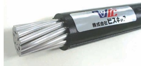
図3 リサイクル材適用OC電線 OC insulated wire using recycled cross-linked polyethylene.

以上の結果, シランリサイクル材は配合率25%で全ての規格値に満足する特性が得られました。水蒸気リサイクル材は, 配合率50%で加熱変形率を除く全ての項目で規格値を満足しており, 配合率を25%にすることで加熱変形率の特性も改善されるものと容易に推測できます。シランリサイクル材, 水蒸気リサイクル材ともに25%程度までの配合であれば, 要求されるOC電線の規格値を満足するものと考えられます。