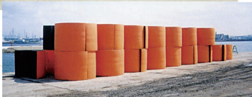
●積み方を選ばない省スペース保管例