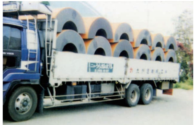
●トラック荷台への積み込み例