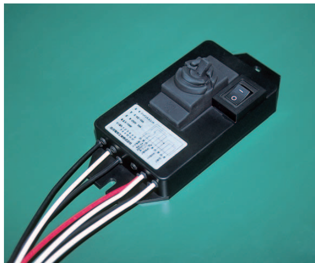
ジョイント ユニット