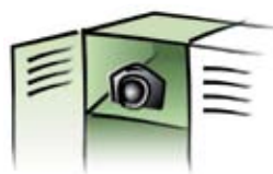
ロッカー・下駄箱・カメラ 精密機器