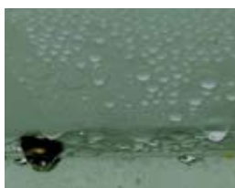
取付け前結露の様子