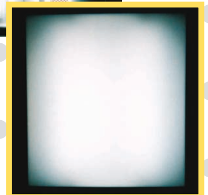
FL20×2本、ピッチ250mm 乳半:三菱レイヨン#430 3tmm 看板厚さ:90mm