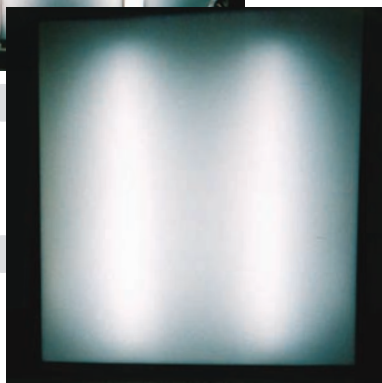
FL20×2本、ピッチ250mm 乳半:三菱レイヨン#430 3tmm 看板厚さ:90mm