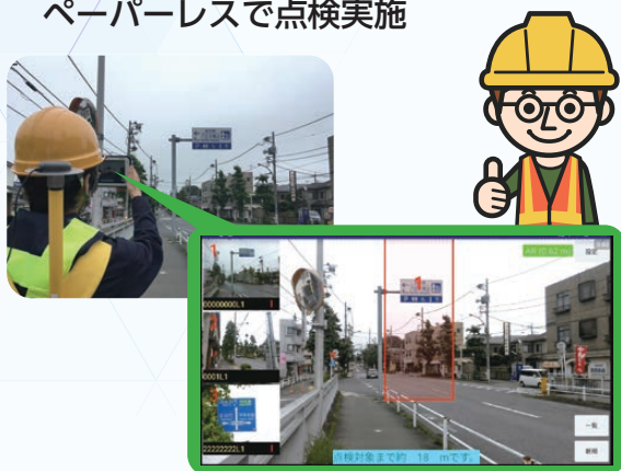
タブレットのAR画面例