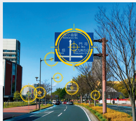
走るだけ！附属物点検表作成サービス

より早く、より安く、より正確に。 DXで効率的な道路附属物の メンテナンスサイクルを実現します！