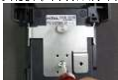
ネジ穴1つタイプでの取付